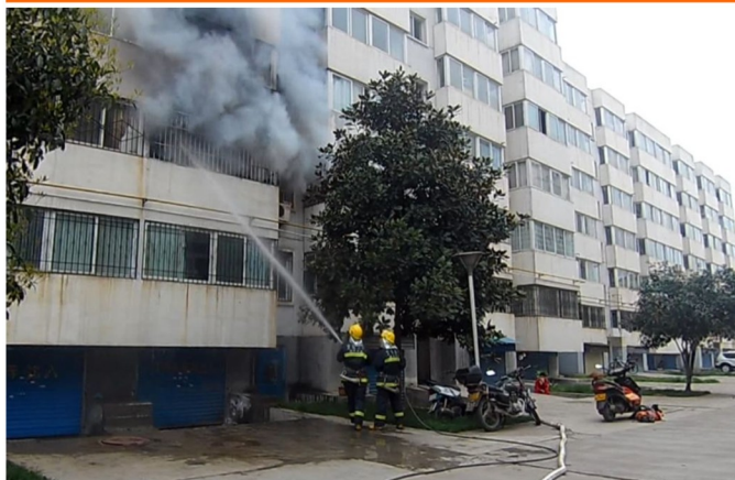
居民楼火灾现场（轻便快捷）